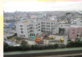
***現在、掘削の工事中***

より多くの患者さんを受け入れられるよう、また更なる質の高い医療を提供できる環境を整えていきます。今後も職員一同一丸となり、皆さんの健康維持・増進のためを注いでいきたいと思います。